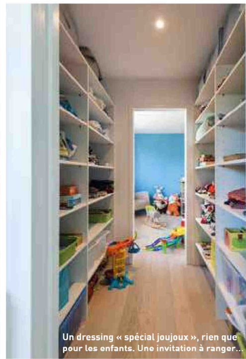
Un dressing « spécial joujoux », rien que pour les enfants. Une invitation à ranger...