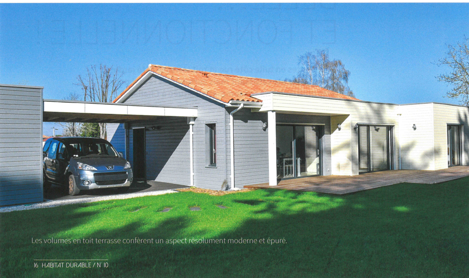
Les volumes en toit terrasse confèrent un aspect résolument moderne et épuré.