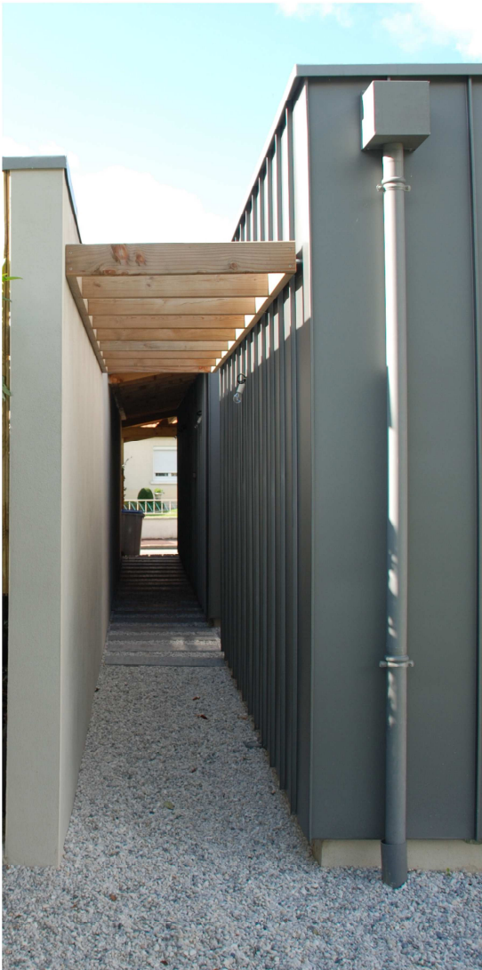
Un auvent voiture distribue un garage ainsi qu'une coursive semi-couverte tel un « faux-mitoyen » permettant aux propriétaires de pouvoir évacuer leurs déchets verts sans passer par la maison.