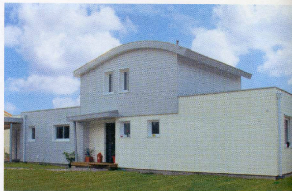
Les pièces de service sont quant à elles placées au nord derrière une façade peu ouverte.

Située dans un cadre verdoyant, elle respecte les principes bioclimatiques : les pièces de vie s'ouvrent largement au sud, tandis que les pièces de service font office de zones tampons, côté nord. Elle a reçu la certification PEFC et Charpente 21 du charpentier (Les Charpentiers de l'Atlantique – La Boissière-de-Montaigu).