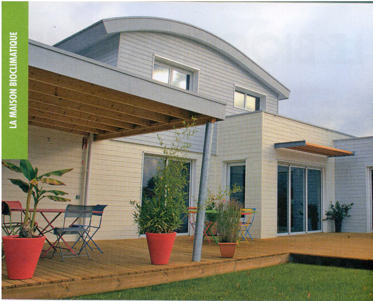
Conception et photos : Architecte Samuel Mamet